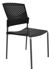
PN4 A : 17" C : 18" E : 13"