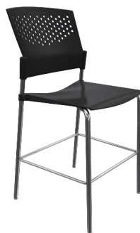
PN7 A : 17" C : 24" E : 13"