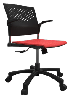
PNL A : 17" C : 17-22" E : 13"