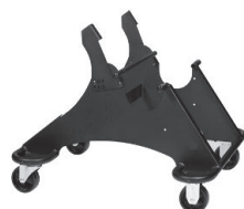
PN20 A : 22" C : 24"