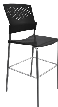
PN8 A : 17" C : 30" E : 13"