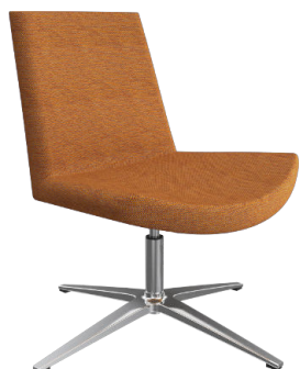
Simone EVSC A : 20" C : 16 1/2" E : 18"