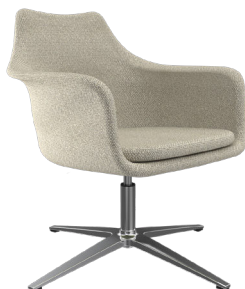
Frida EVFC A : 20" C : 19" E : 15"