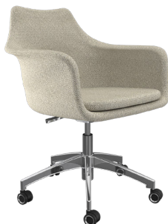
Frida EVFE A : 20" C : 17 1/2" - 21" E : 15"