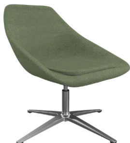
Malala EVMC A : 19" C : 18" E : 18"