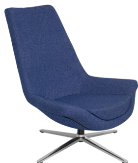
Rosa EVRC A : 20" C : 15 1/2" E : 27"