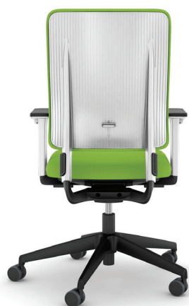
DRR3-DW A : 19" C : 17" - 22" E : 20"