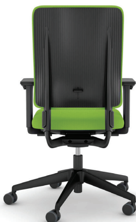
DRR3-DN A : 19" C : 17" - 22" E : 20"